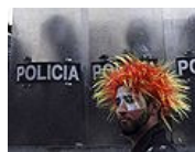
11.11.2011 14 Студенческие протесты в Колумбии

технического осмотра. Только с 28 октября по 27 ноября 2011.