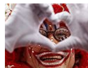
11.11.2011 11 Сезон карнавалов в Германии